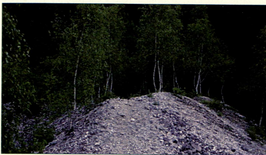
Piante pioniere: betulle

Oggi sono qui che osservo le prime primule che fanno capolino tra i sassi, un po' stentate; il tempo ha lavorato molto, ma non è facile trasformare la roccia in humus e le loro foglie un po' ingiallite testimoniano che c'è ancora da fare. L'antico spoglio mucchio di detriti si è ridotto sotto l'attacco degli avamposti