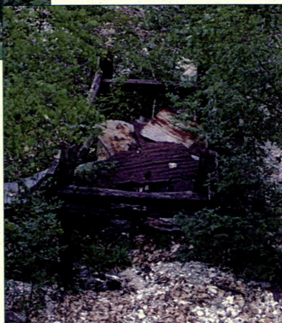
Quel che resta della struttura di partenza della teleferica

ogni pezzo la sua essenza: il faggio per i pattini garantiva robustezza e rigidità, il frassino per i montanti dava elasticità, il tiglio per i traversi assicurava leggerezza e resistenza anche dopo le forature per le "bachete" del piano di carico, fatte di polloni di orniello, elastico e resistente.