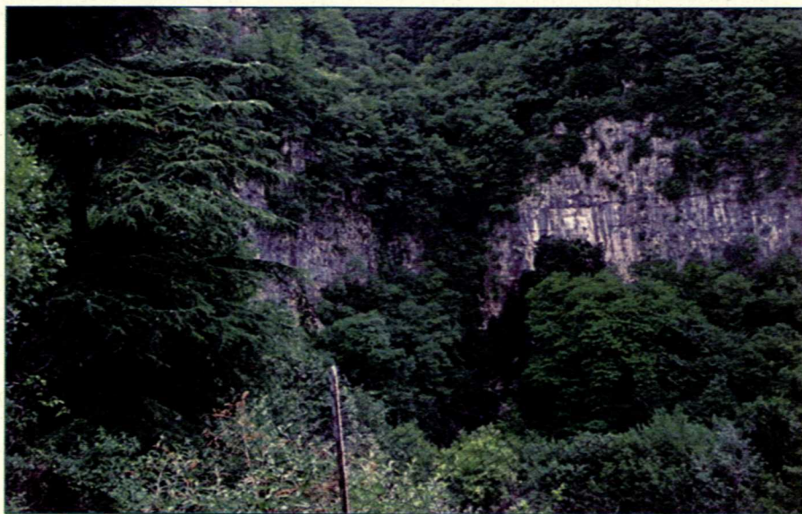
L'ultimo balzo della valle Rana